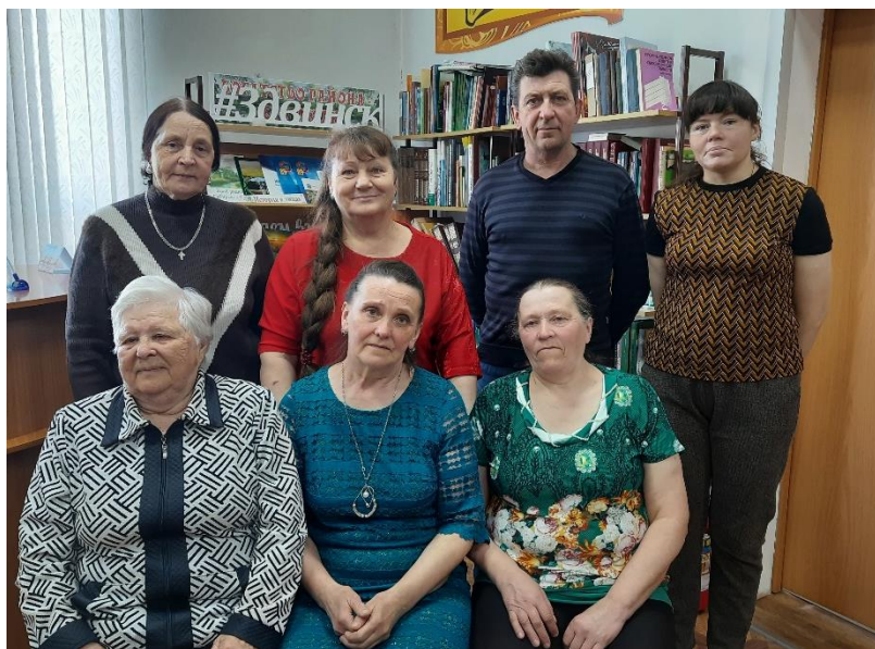
Члены клуба "Приют Гамаюна".